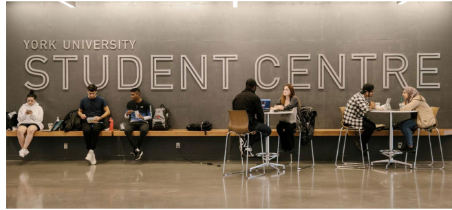
图表 5 加拿大约克大学学生中心