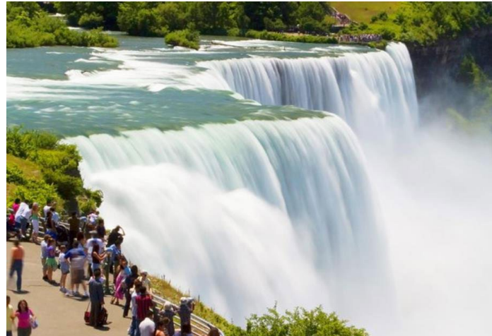
图表 6 参观尼亚加拉瀑布（Niagara Falls）