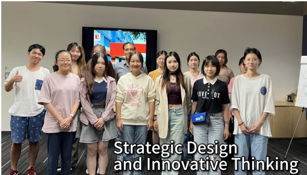
图表 2 课堂合照