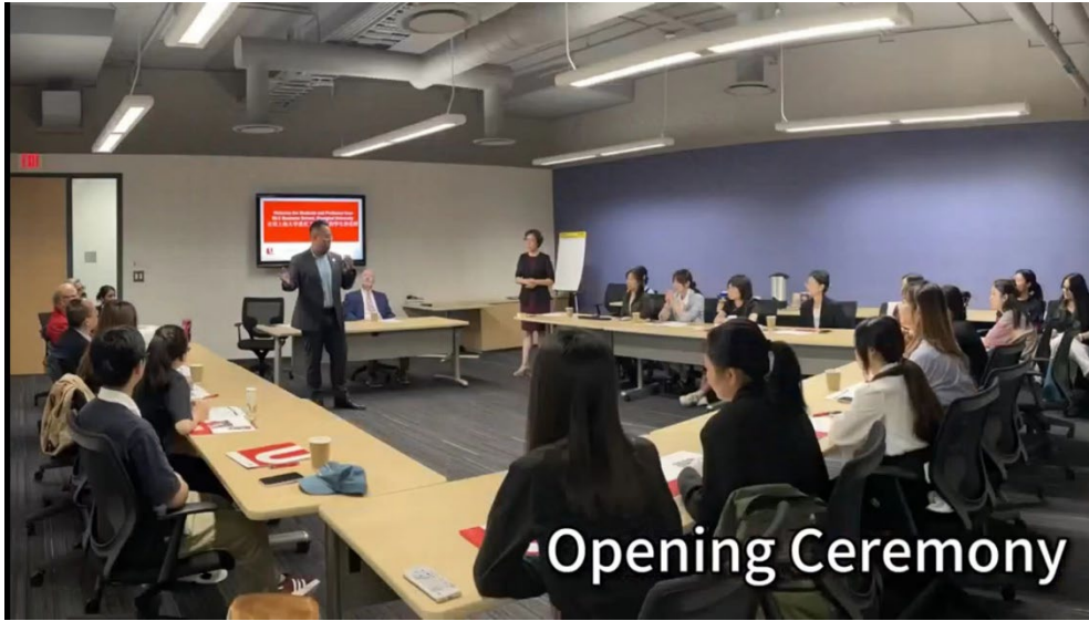
图表 1 开学典礼