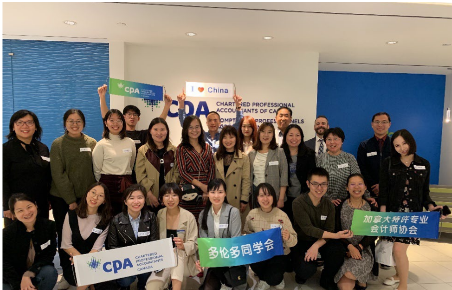
图表 3 参观加拿大 CPA 协会